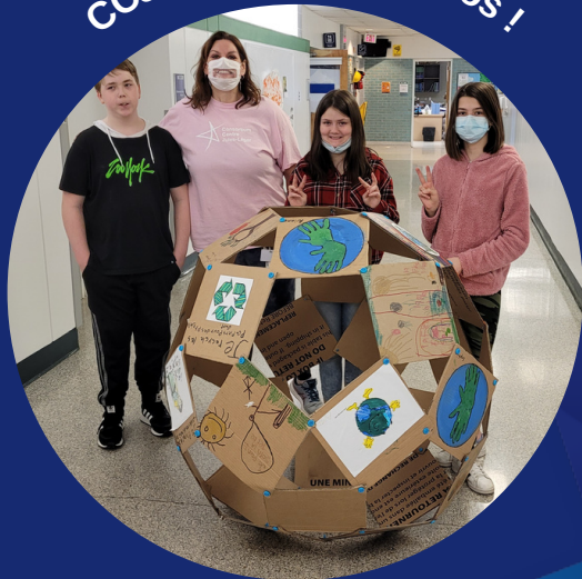
CCJL des écoles écolos !