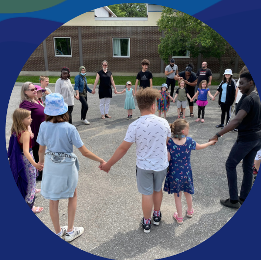
Classes plein air