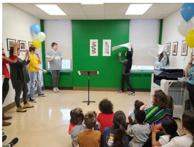
Photo : Dévoilement d'une des toiles