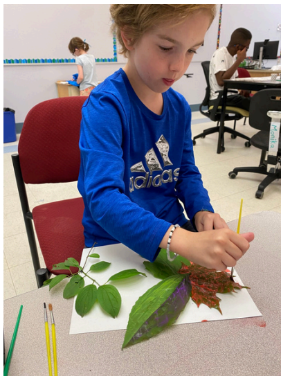
Photo d'un élève du Camp Sans Limite

Le Camp Sans Limite incarne la mission du CCJL : offrir des occasions d'épanouissement uniques aux jeunes ayant des besoins particuliers, tout en favorisant l'inclusion et l'autonomie. C'est une occasion précieuse pour ces jeunes de vivre des aventures estivales adaptées et de créer des souvenirs inoubliables.