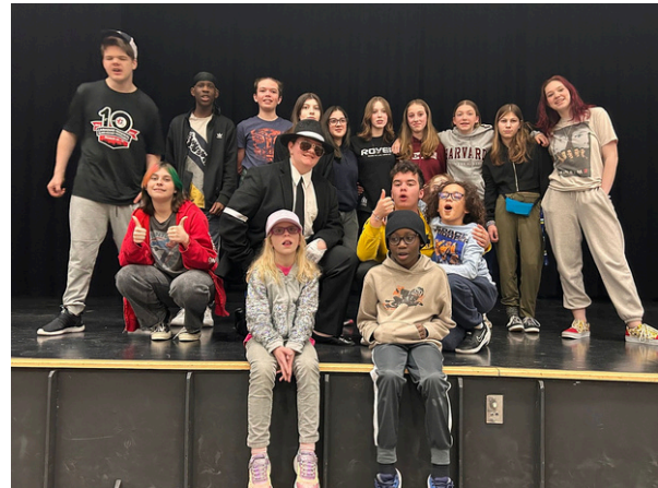
Photo de groupe : Élèves de l'École provinciale et de l'École d'application