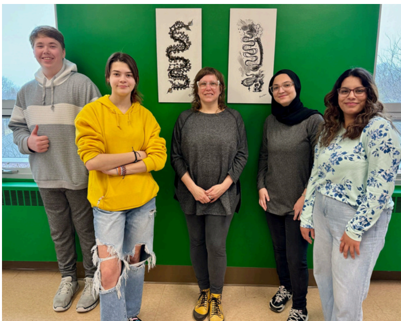
Photo de groupe : Élèves de l'École provinciale au côté de l'artiste Pamela Witcher.

Le point culminant de cette aventure enrichissante a eu lieu lors d'une cérémonie de dévoilement des toiles, en présence de l'artiste. Pamela Witcher, dont les œuvres sont exposées à travers le Canada et les États-Unis, a partagé sa vision : «Lorsque les communautés sourdes créent de l'information à travers l'art et la documentation, notre existence devient concrète, reconnue et valorisée».