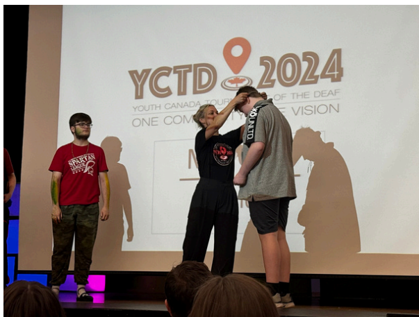
Photo d'un élève de l'École provinciale lors de la remise des prix.

Nos élèves ont brillamment représenté le CCJL dès la cérémonie d'ouverture, défilant avec fierté et enthousiasme. Tout au long du tournoi, ils ont participé à une variété d'activités stimulantes, démontrant leur talent et leur esprit d'équipe dans des domaines allant des arts aux sciences.