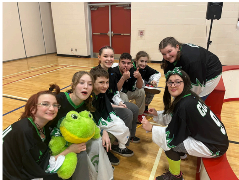
Photo de groupe : Élèves de l'École d'application au tournoi Gazou d'or

Ce tournoi offre à tous les jeunes une plateforme unique pour exprimer leur créativité, relever des défis et tisser des liens avec d'autres jeunes partageant la même passion. Une expérience inoubliable qui contribue pleinement à leur développement personnel et académique.