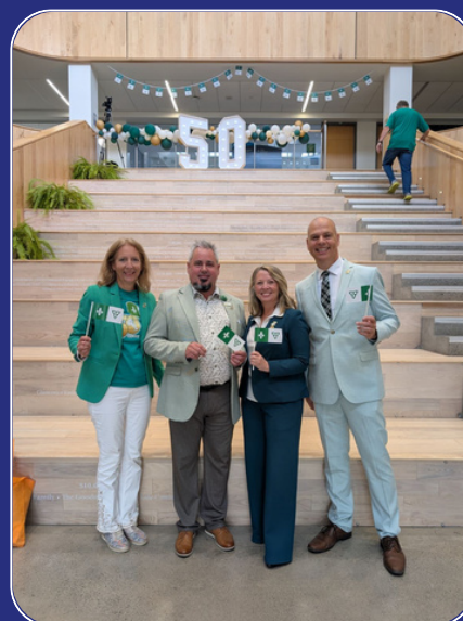
Photo de groupe : France Gélinas, députée provinciale NPD, Jean-François Boulanger, directeur de l'éducation au CCJL, Marit Stiles, députée provinciale NPD, Jamie West, député provincial NPD

Les élèves des deux écoles ont participé aux célébrations « ENSEMBLE, TOUJOURS DEBOUT » à la Place TD, une invitation du CECCE. Plus de 8 000 jeunes étaient réunis pour une journée animée par la musique, la danse, le théâtre, des cérémonies, des chorales et le lever du drapeau, créant des souvenirs mémorables. Ce fut un moment de construction identitaire fort.